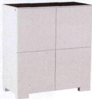
Komoda, drewno i melamina westwing.pl .3149 zł