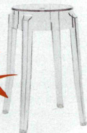
Stołek Charles Ghost, proj. Philippe Starck, Kartell 480 zł