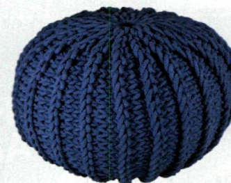
Puf Nordic, Westwing.pl 199 zł