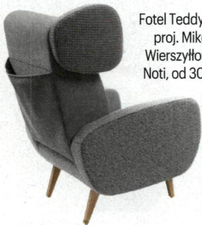
Fotel Teddy Bear, proj. Mikołaj Wierszyński, Noti, od 3060 zł