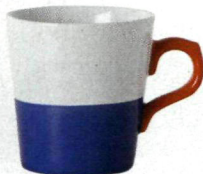
Kubek Colour Stripe, Zara Home, 29,90 zł