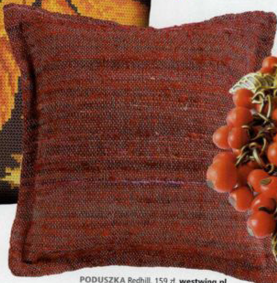
PODUSZKA Redhill, 159 zł, westwing.pl