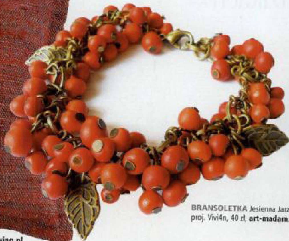
BRANSOLETKA Jesienna Jarzębina, proj. Vivi4n, 40 zł, art-madam.pl