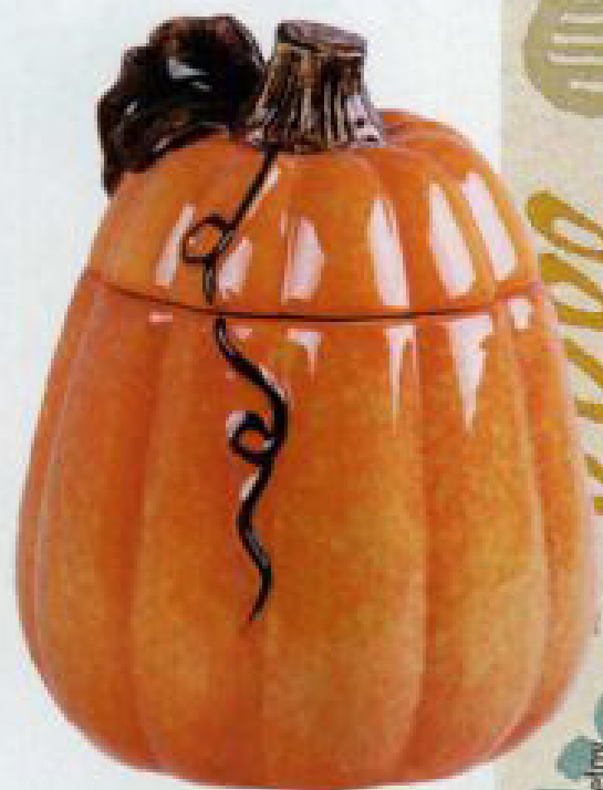
DYNIA na dłużej, czyli pojemnik Pumpa, 49 zł, home-you.com