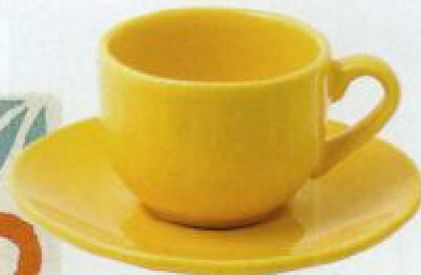
FILIŻANKA DO KAWY Circle, Pagnossin, 79 zł/6 szt., westwing.pl

K iedy kasztany „jak rudy lecą grad”, a jesień mówi do nas wszystkimi odcieniami złota, pora na spacer! Wazony czekają na bukiety liści, kubki – na gorącą herbatę, a jarzębina prosi, by zamienić ją w biżuterię. Wprowadźmy do domu kolory podpatrzone w parku czy lesie: jaskrawy żółty jak dojrzały liść brzozy, buczynową czerwień albo kilka barw naraz – tak jak jesień maluje czasem na klonowym listku. ■