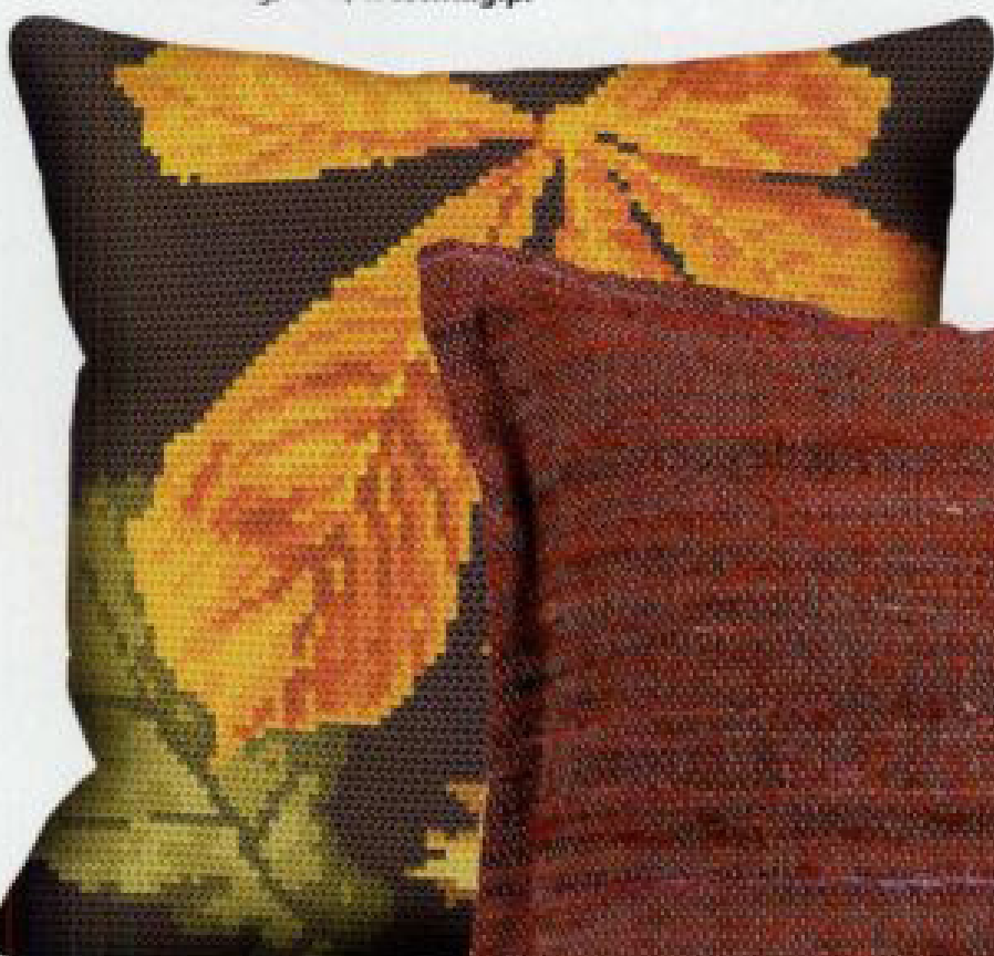
NA LIŚCIU Poduszka z gotowym zestawem do haftu (mulina, igła i wzór), 83 zł, coricamo.pl