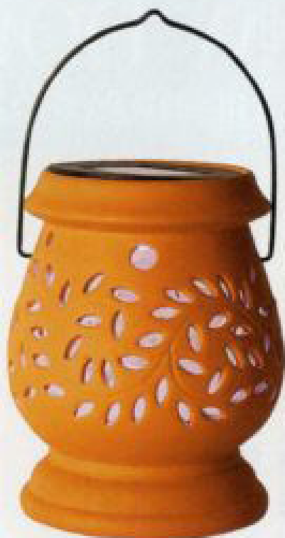
LATARENKA lędowa Bauglier, Star Trading, 49 zł, westwing.pl