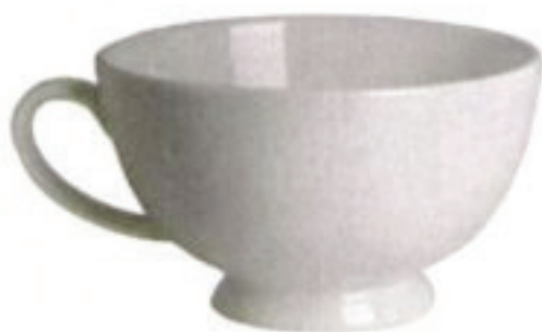
Kubek Mia, Duka, 29,90 zł