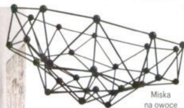
Miska na owoce Molekuły, BoConcept, 259 zł