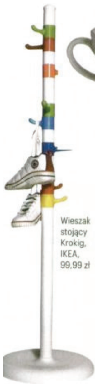
Wieszak stojący Krokig, IKEA, 99,99 zł

REDAKTOR NACZELNA MIESIĘCZNIKA „DOM & WNETRZE” PROWADZI WŁASNY PROGRAM W TELEWIZJI DOMO+