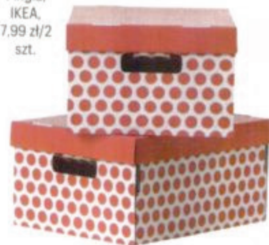
Pudełko Pingla, IKEA, 7,99 zł/2 szt.