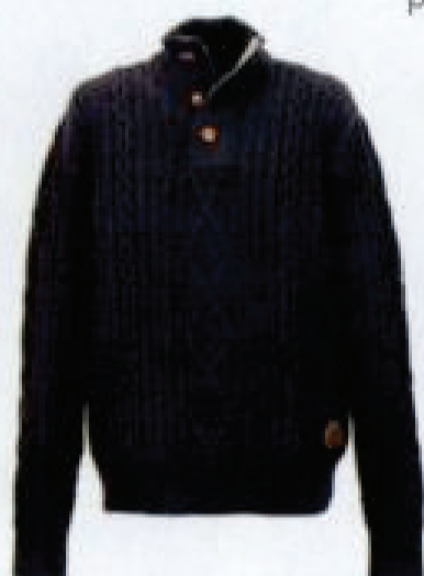
Sweter BARBOUR 849 zł