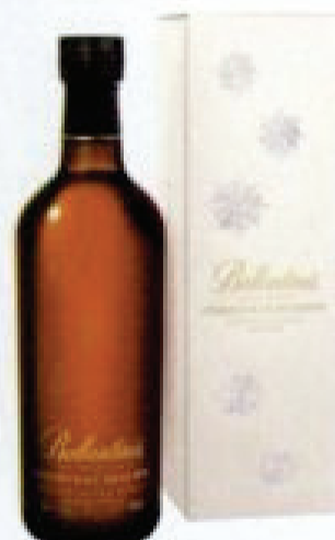
BALLANTINE'S Christmas Reserve, 122 zł/0,7 l