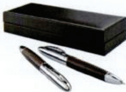
Długopis i pióro MILLAU 159 zł, Westwing.pl