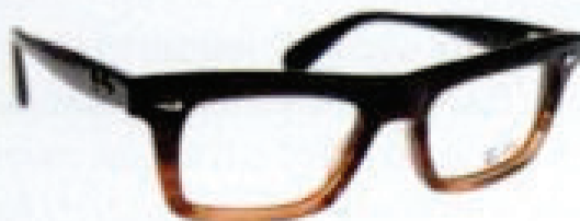
Okulary RAY-BAN 600 zł