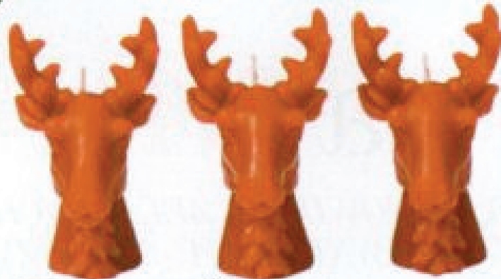
ZESTAW 3 ŚWIEC RENTIER 399 zł, Westwing.pl