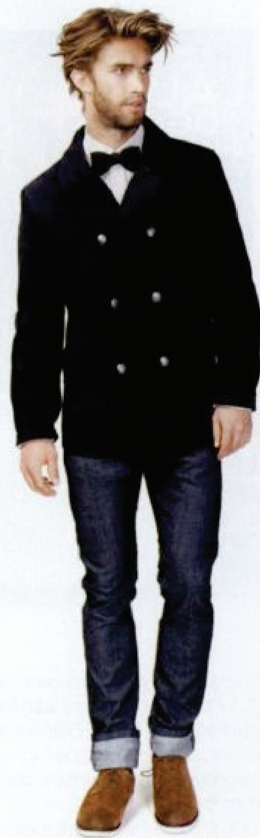
SPRINGFIELD Old Taylor 2012