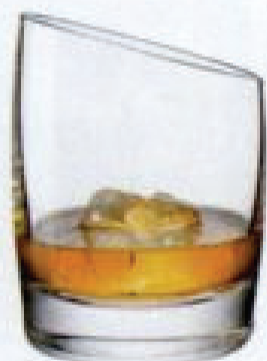
Szklanka EVA SOLO/ FABRYKA FORM 122 zł