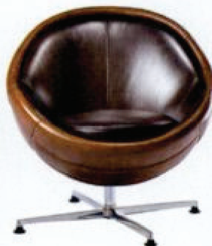
Fotel skórzany WEMBLEY 5700 zł, Westwing.pl