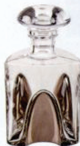
Karafka DEKANTER PLATIN 399 zł, Westwing.pl