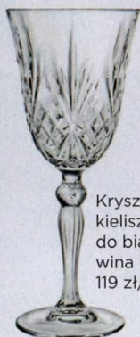
Kryształowy kieliszek do białego wina Melodia, 119 zł/6 szt.

Na moim stole znajdują się także kryształowe kieliszki i szklanki. To materiał, który powraca na salony w wielkim stylu, i zapewniam - będzie o nim jeszcze głośno!