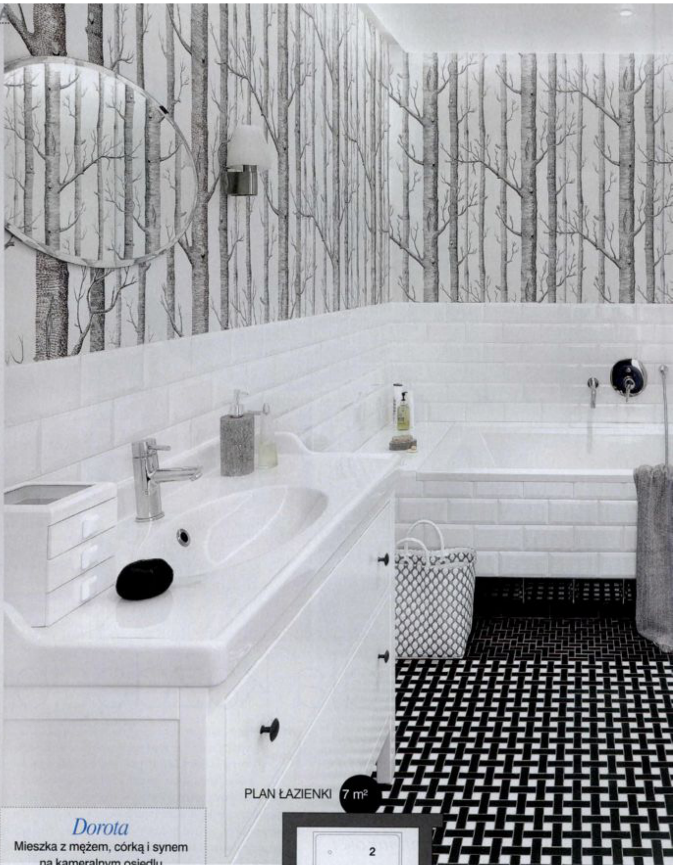
PLAN ŁAZIENKI 7 m 2