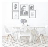
Mieszkanie wiedeńskiej blogerki, Caroli Pojer, fot. westwing.pl