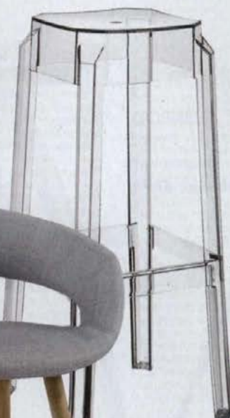
◀ FOX, wys. 75 cm, poliwęglan westwing.pl .249 zł