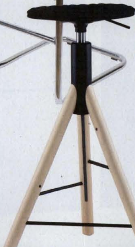
◀ MANNEQUIN BAR, wys. regulowana 68–80 cm, drewno Iker .1380 zł