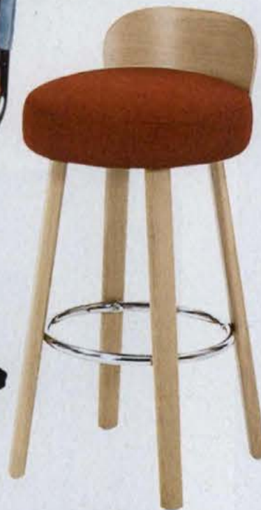
▲ K2, wys. 75 cm, drewno bukowe lub dębowe i tkanina Paged .870 zł