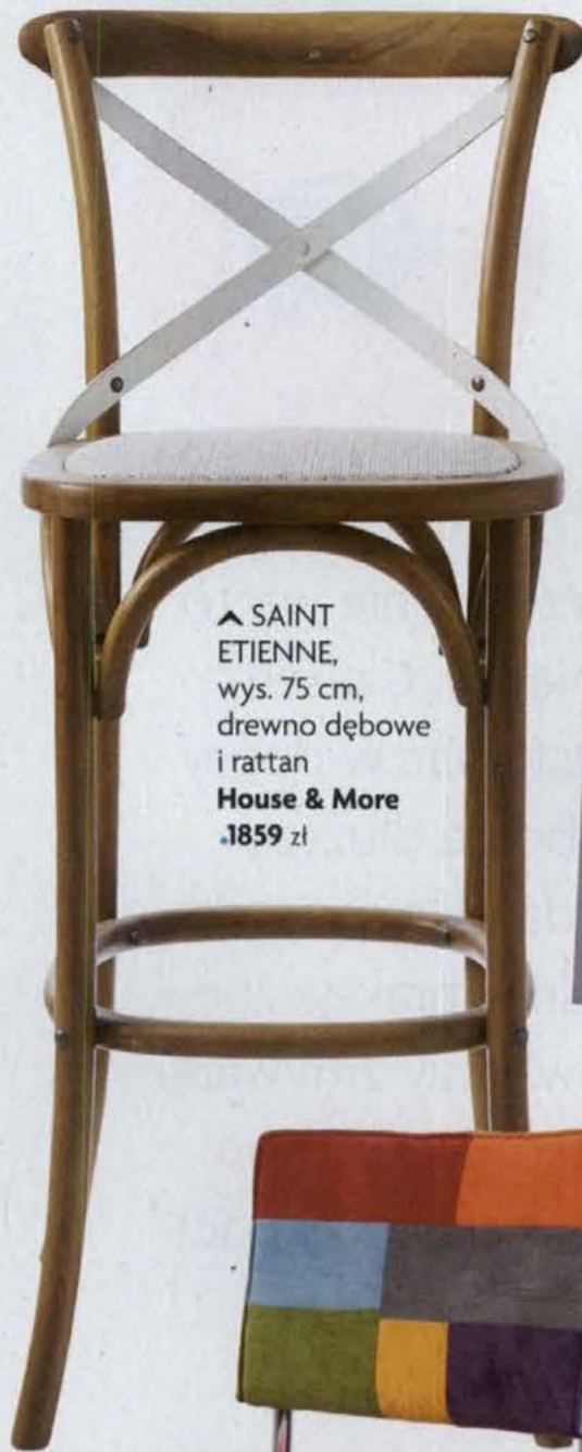
▲ SAINT ETIENNE, wys. 75 cm, drewno dębowe i rattan House & More .1859 zł