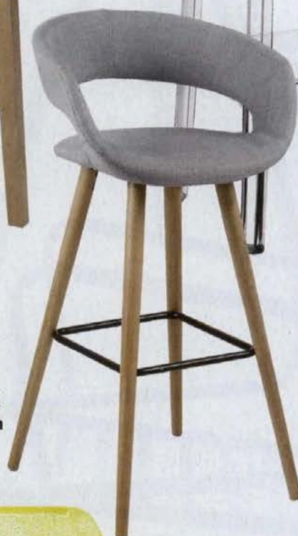
▲ GRACE, wys. 97 cm, drewno i tkanina meble.pl .499 zł