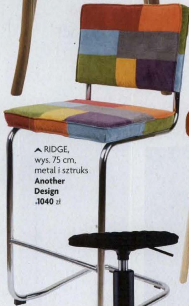
▲ RIDGE, wys. 75 cm, metal i sztruks Another Design .1040 zł