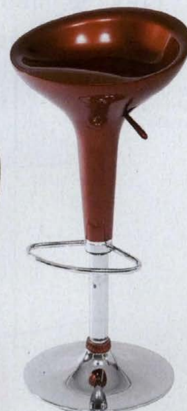
▲ FUNNEL, wys. regulowana 67–88 cm, stal i tworzywo sztuczne archonhome.pl .189 zł