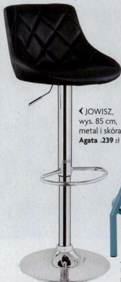
◀ JOWISZ, wys. 85 cm, metal i skóra Agata .239 zł