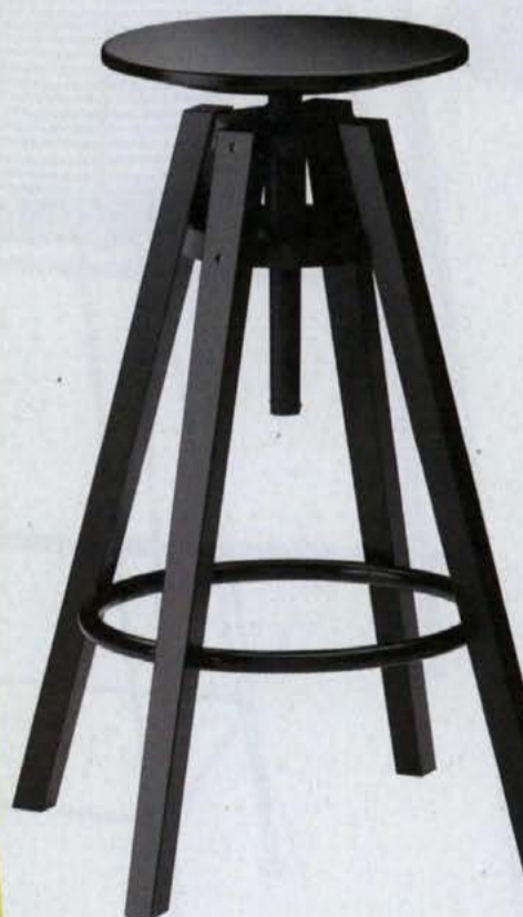
▲ DALFRED, wys. regulowana 63–74 cm, drewno i stal IKEA .149 zł