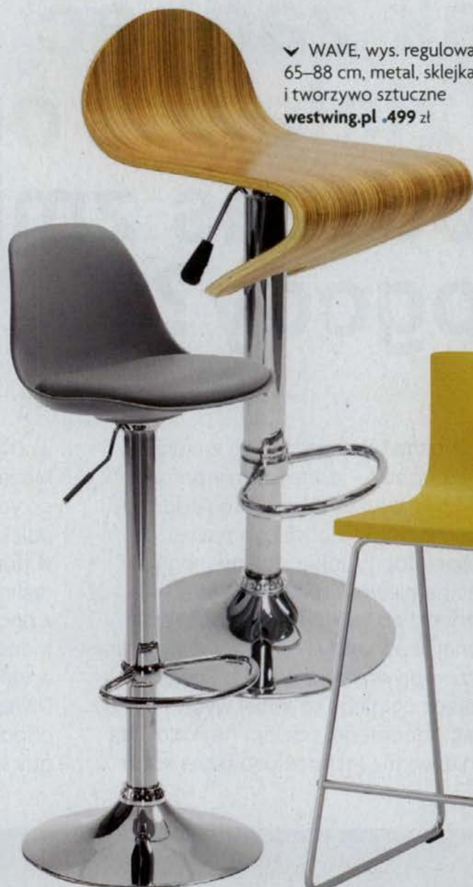
▼ WAVE, wys. regulowana 65–88 cm, metal, sklejka bukowa i tworzywo sztuczne westwing.pl .499 zł