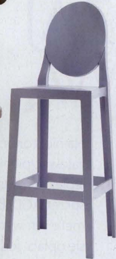
▲ ONE MORE PLEASE, wys. 100 cm, tworzywo sztuczne Kartell .1060 zł