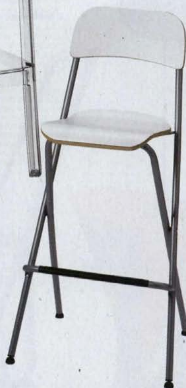
▲ FRANKLIN, wys. 63 cm, stal i sklejka IKEA .89 zł