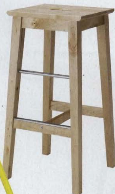
◀ BOSSE, wys. 74 cm, drewno IKEA .119 zł