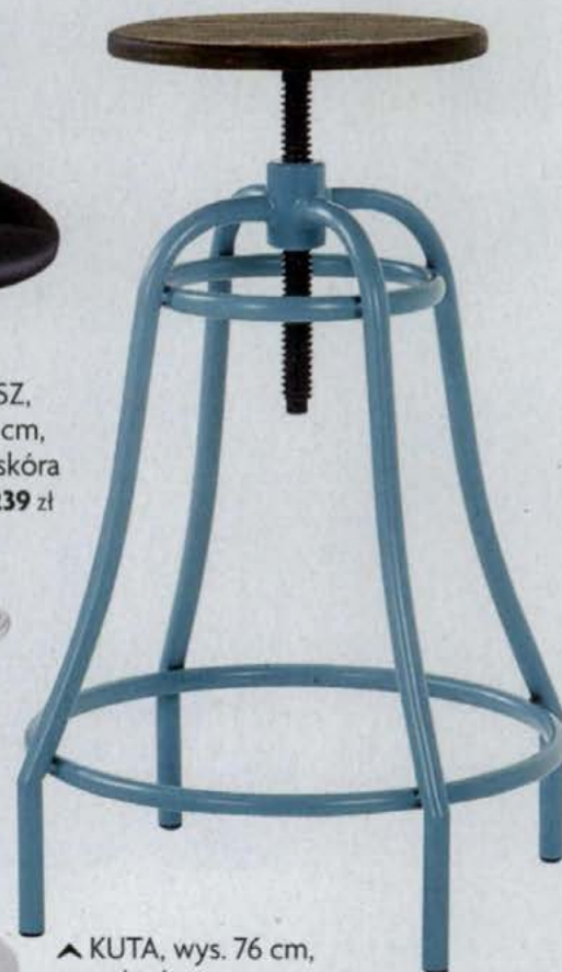
▲ KUTA, wys. 76 cm, metal i drewno sfmeble.pl .469 zł