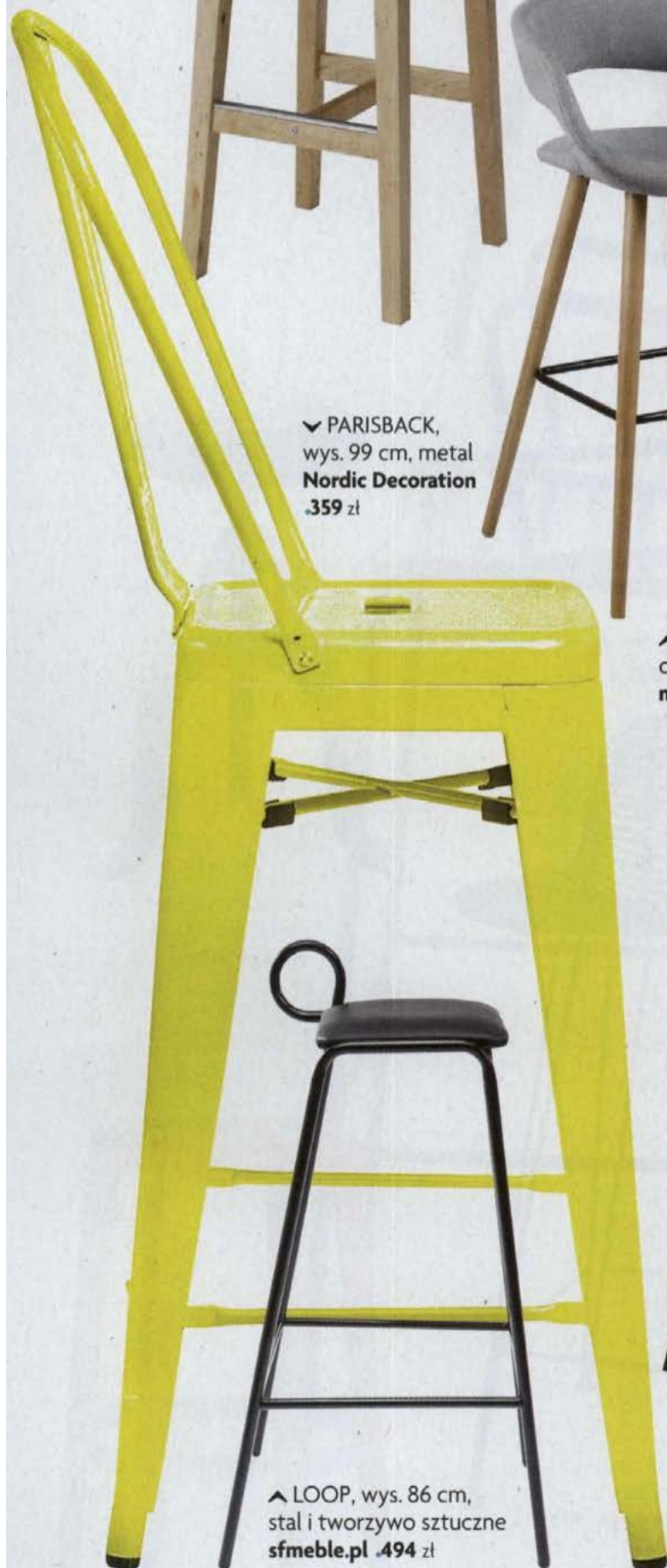
▼ PARISBACK, wys. 99 cm, metal Nordic Decoration .359 zł